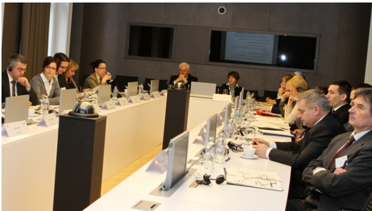
Встреча руководителей агентств по защите конкуренции.